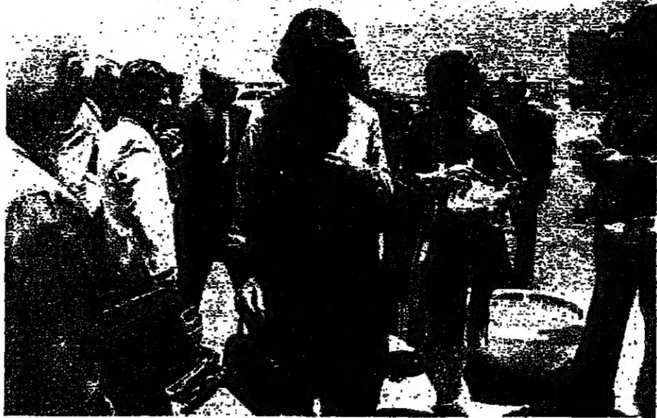
الوزيران بطرس وخادم ومغتالهما في جديده يابوس على الحدود اللبنانية السورية